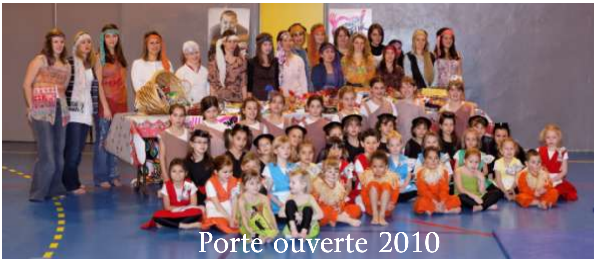
Porte ouverte 2010