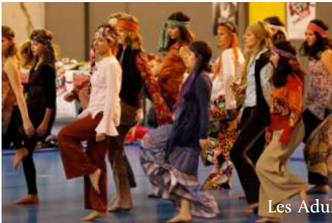
Les Adultes 1 & 2